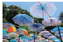
アンブレラスカイ

〒437-0061 静岡県袋井市久能 2915-1 TEL: (0538)42-2121(代)/FAX: (0538)42-1429 https://www.kasuisai.or.jp