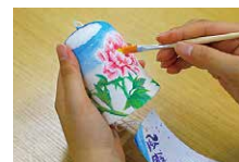
お絵描き風鈴体験