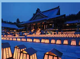
万灯祭(法多山) 7月9日(火)・10日(水)