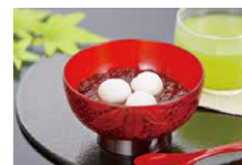
水無月ぜんざい・冷茶