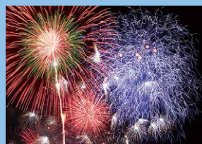
ふくろい遠州の花火(原野谷川親水公園) 7月27日(土)