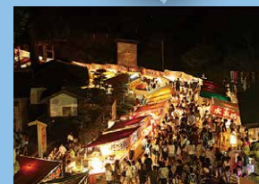
奥之院不動尊大祭(可睡齋) 8月28日(水)

行事やイベントは天候や社会状況によって開催日や内容が変更になる場合がございます。