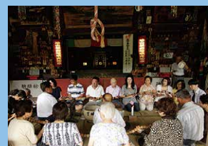
百万遍(油山寺) 8月8日(木)